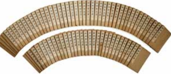
여유당전서 與猶堂全書 16.8×26.3

『변암집』은 조선 후기의 문신이며 학자인 채제공(蔡濟恭)의 시문집으로 60권 27책이다. 『만덕전』은 『변암집(樊巖集)』권55 전(傳)에 실려 전하며, 권19에서는 크게 만덕을 노래하고 있는 칠언율시의 전반부와 만덕의 행적을 간략하게 서술한 후반부로 나누어져 기록되어 있다.