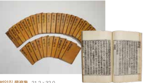
변암집 樊巖集 21.2×32.0

『고식』은 조선 후기의 문신인 김희락(金熙洛)의 시문집으로 5권 3책으로 되어 있다. 이 가운데 만덕 이야기는 권4의 전(傳)에 『봉교제진만덕전 (奉敎製進 萬德傳)』이라는 제목으로 수록 되었다.