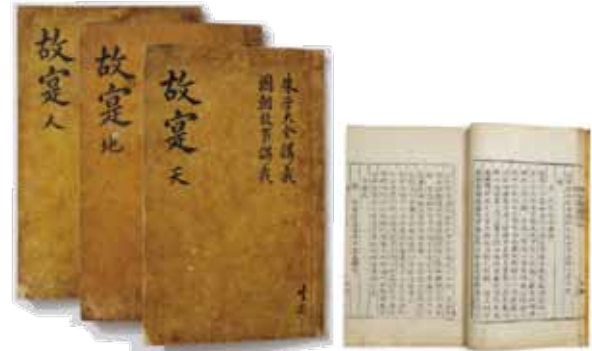
고식 故寔 20.4×32.5

『고식』은 조선 후기의 문신인 김희락(金熙洛)의 시문집으로 5권 3책으로 되어 있다. 이 가운데 만덕 이야기는 권4의 전(傳)에 『봉교제진만덕전 (奉敎製進 萬德傳)』이라는 제목으로 수록 되었다.