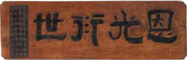
은광연세 恩光衍世 98.0×31.0

김만덕 6대손 김균 기증. '은혜의 빛이 온 세상에 퍼진다'는 뜻이다. 조선 후기 대표적인 서예가인 추사 김정희의 글씨로 추사가 제주에 유배 왔을 때 제주 사람들로 부터 전해 듣기를 대기근에 처한 제주도민을 구하기 위해 평생 모은 재산을 내놓은 의인 김만덕이 세상 떠난 지 30년이 넘도록 칭송받자, 그의 선행을 기려 3대손인 김종주에게 써 줬다고 한다. 편액에 쓰여진 내용은 다음과 같다.